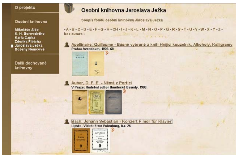
Obr. č. 2 – Stránka se soupisem fondu osobní knihovny J. Ježka umístěné v Modrém pokoji

Každá z šesti jmenovaných knihoven je prezentována textovým a obrazovým obsahem. Jsou zde obsaženy informace o historii fondu, jeho velikosti, informace o čtenářství původního majitele, popř. další zjištěné informace související s knihami z té které osobní knihovny. Jádrem každé sekce je „soupis“ konkrétní osobní knihovny, v němž jsou k dispozici k prohlídce knihy připisované údajně či průkazně (podle podpisu, exlibris, věnování, vpisků) do fondu osobní knihovny. V soupisu je možno pohybovat se pomocí volby prvního písmene příjmení autora knihy nebo prohlížet stránky soupisu pomocí posuvníku. Díky soupisu může uživatel nahlédnout do osobní knihovny, prohlédnout si data o titulech, které do ní patří nebo s největší pravděpodobností patřily, a digitální kopie výše zmíněných výjimečných prvků společně s digitální kopií obálky a titulní stránky ve svazcích individualizovaných. Soupis je uživateli předkládán jako interaktivní seznam. Popis jednotlivých knih je proto prezentován jako „citace“ v některých případech ilustrované obrazovými kopiemi.