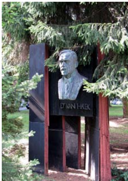
Pomník v Žilině